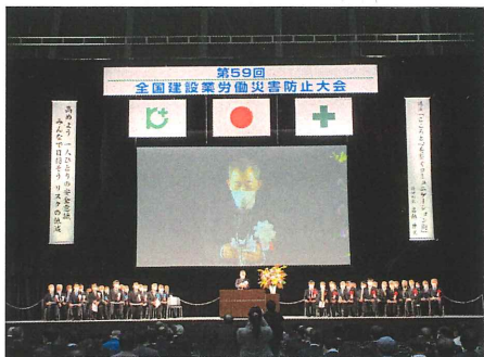
大会総合集会・表彰式

なお今回も昨年に引き続き、現地開催とオンライン配信を組み合わせたハイブリット開催となり、6日にはライブ配信が行われた他11月14日までオンデマンド配信も行われています（要参加券）