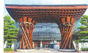
専門部会会場周辺（金沢駅）

今年の全国大会は、11月6・7日、いしかわ総合スポーツセンターほかにおいて、厚生労働省、国土交通省、石川県、金沢市、石川労働局の後援等のもと、「高めよう 一人ひとりの安全意識 みんなで目指そう リスクの低減」を大会スローガンに開催されました。