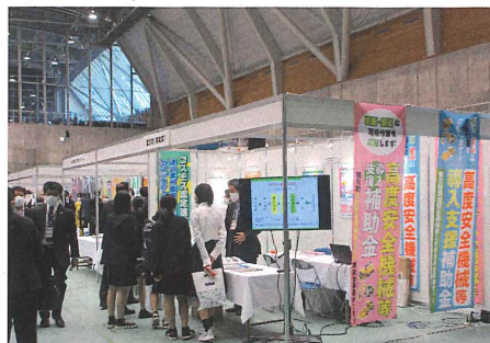
安全衛生保護具・測定機器・安全標識展示会