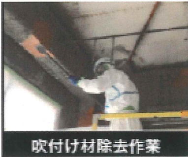
吹付け材除去作業

建築物石綿含有建材調査者は、建築物石綿含有建材調査者講習を受講し、修了考査に合格した者とされています。施行日は令和5年10月1日と残り