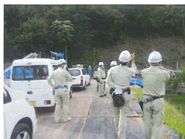
社内安全パトロール