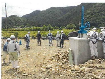
建災防南但分会安全パトロール