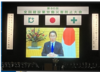
大会総合集会・表彰式会場