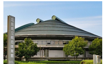
広島グリーンアリーナ

なお今回も11月13日までオンデマンド配信も行われています(要参加券、当日参加者も可)。