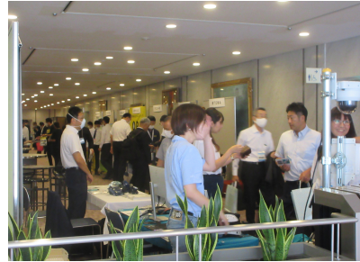
安全衛生保護具・測定機器・安全標識展示会