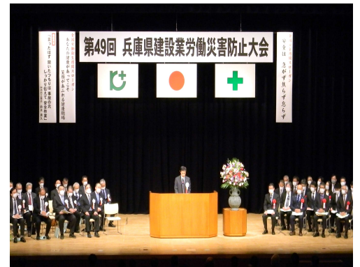
昨年第49回大会の様子 CPDS 835284 (2ユニット)