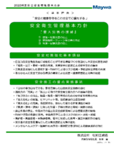
安全パトロール 職長教育