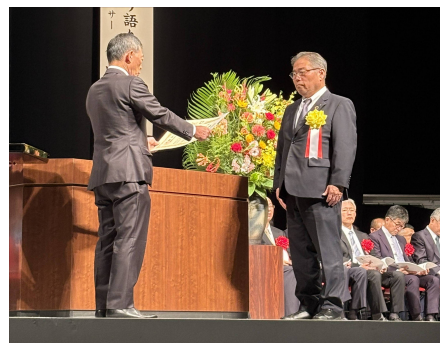
ソネック STC 会