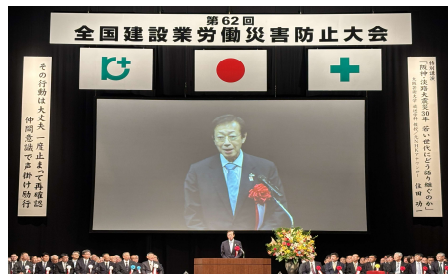
神戸市長ごあいさつ