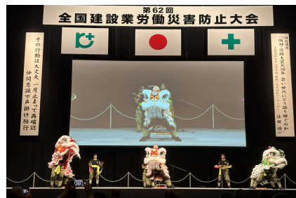
神戸華僑總會舞獅隊