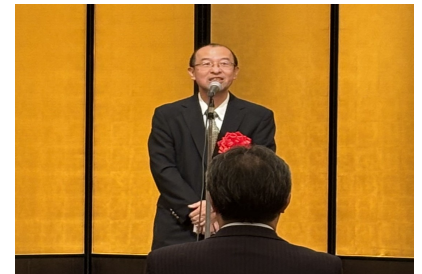
兵庫県技監ごあいさつ