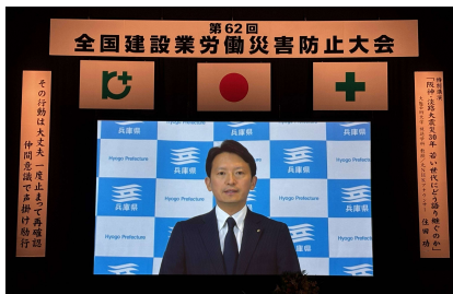
兵庫県知事ごあいさつ（ビデオ）

この大会の参加者は、初日4,600名、2日目2,600名の計7,200名となり、昨年の東京大会と同数となりました。