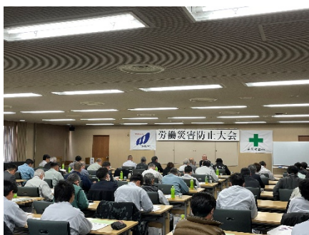
労働災害防止大会