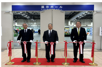
展示会テープカット