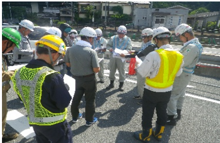
【日興会役員パトロール】